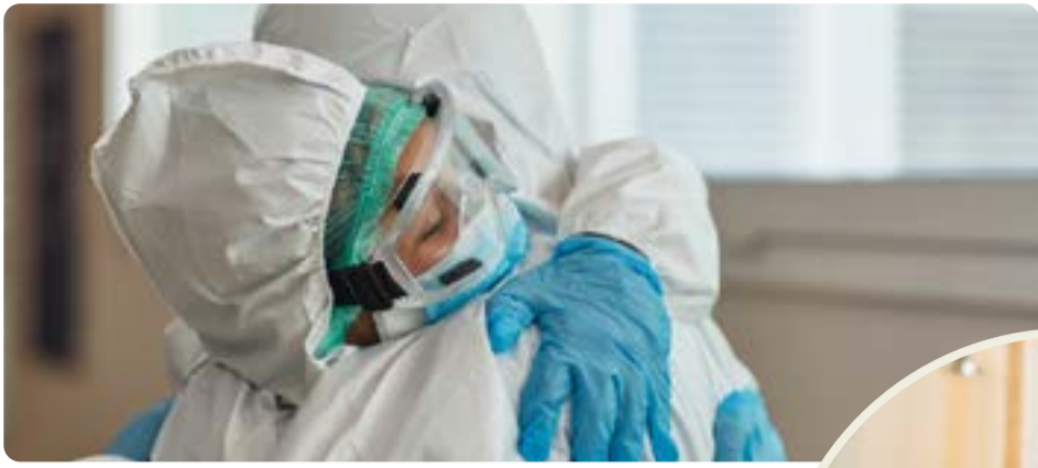
Pandemin visade på brister i välfärden. Vänsterpartiet vill bygga samhället starkt igen.