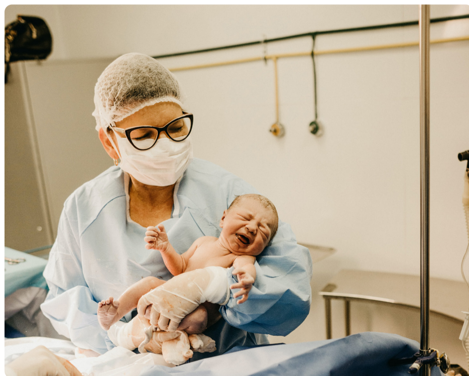
Vänsterpartiet har länge kämpat för en bättre förlossningsvård.