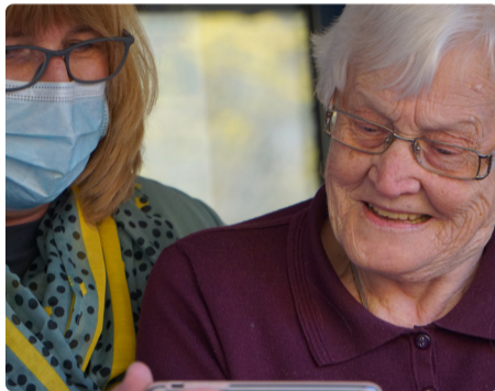
Fler ska kunna arbeta heltid inom vård och omsorg.

Vänsterpartiet vill öka antalet medarbetare som har heltidstjänster och att fler faktiskt väljer att arbeta heltid. Detta är ett stort förändringsarbete som innebär bl. a. förändrade arbetssätt, samarbete och delaktighet. Vänsterpartiet vill kun-