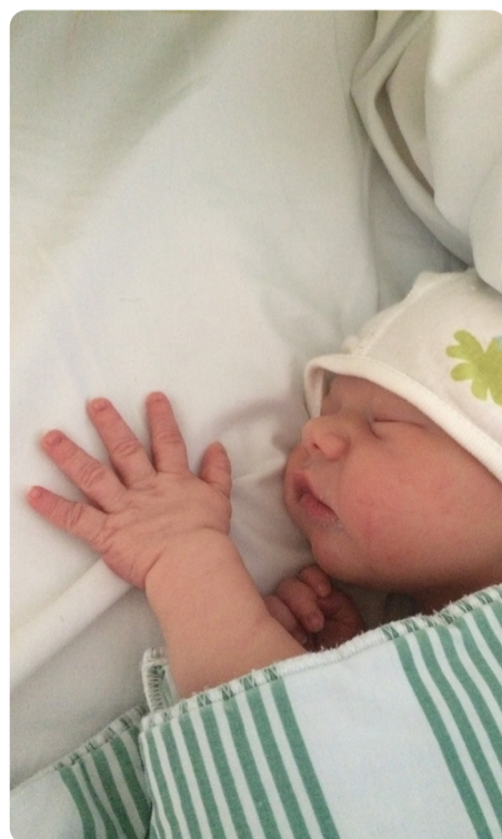
Lille Fabian föddes på Sollefteå sjukhus.